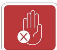
No sentarse No pararse No utilizar