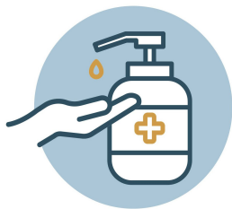
LIMPIA TUS MANOS CON GEL ANTIBACTERIAL ASIDUAMENTE

Se deberá colocar material informativo en las entradas, áreas de trabajo, sanitarios y espacios comunes, sobre las buenas prácticas preventivas (lavado continuo de manos, estornudo en el ángulo interno del codo, uso de equipo de protección personal, entre otras).