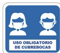
Uso obligatorio de cubrebocas