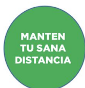
Sitios de espera en la fila