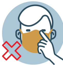
NO TOCAR CARA, OJOS, NARIZ Y BOCA