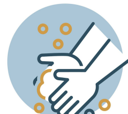
LAVA CONSTANTEMENTE TUS MANOS CON AGUA Y JABÓN DURANTE 20 SEGUNDOS

Se colocarán infografías oficiales sobre medidas sanitarias ante la emergencia en múltiples lugares visibles. Se deberán exhibir carteles físicos o electrónicos dentro de las instalaciones. De uso general para los espacios al interior y exterior de las carpas (zonas de taquillas, pasillos, vestíbulos y áreas comunes, servicios sanitarios), se establecerá la siguiente señalética: