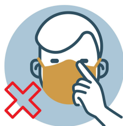
NO TOCAR CARA, OJOS, NARIZ Y BOCA