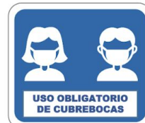
Uso obligatorio de cubrebocas