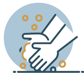
LAVA CONSTANTEMENTE TUS MANOS CON AGUA Y JABÓN DURANTE 20 SEGUNDOS

Se colocarán infografías oficiales sobre medidas sanitarias ante la emergencia en múltiples lugares visibles. Se deberán exhibir carteles físicos o electrónicos dentro de las instalaciones. De uso general para los espacios al interior y exterior de las instalaciones (zonas de taquillas, pasillos, vestíbulos y áreas comunes, servicios sanitarios), se establecerá la siguiente señalética: