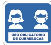
Uso obligatorio de cubrebocas