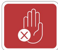
No sentarse No parase No utilizar