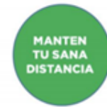
Sitios de espera en la fila

Es necesario poner carteles para mantener sana distancia en todos los espacios del establecimiento y, en caso de existir, zonas de espera. Por ejemplo, las filas de entrada y salida, las filas para el baño, para pagar, para acceder a una clase y en toda aquella fila común en la cual sea necesario mantener la sana distancia.