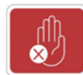
No sentarse No pararse No utilizar

En los espacios, asientos y demás áreas que apliquen, debe señalarse los espacios que no deban usarse con el objetivo de mantener la sana distancia de 1.5 m, es necesario poner letreros para que se evite utilizar dichas zonas.