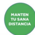
Sitios de espera en la fila

Es necesario poner carteles para mantener sana distancia en todos los espacios del establecimiento y, en caso de existir, zonas de espera. Por ejemplo, las filas de entrada y salida, las filas para el baño, para acceder a una clase y en toda aquella fila común en la cual sea necesario mantener la sana distancia.