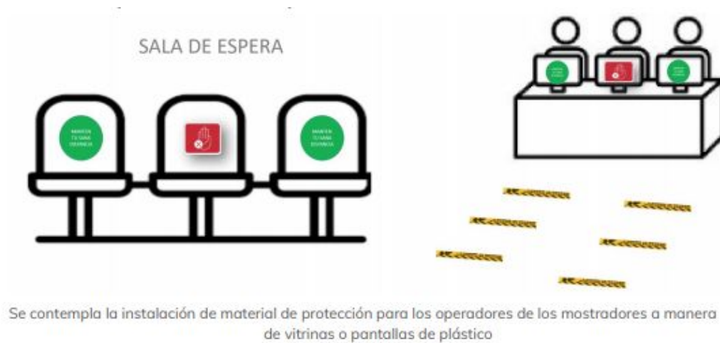
Se contempla la instalación de material de protección para los operadores de los mostradores a manera de vitrinas o pantallas de plástico

Se deberá señalizar en el piso los espacios que deberán respetar los clientes para solicitar los productos o para pagar.